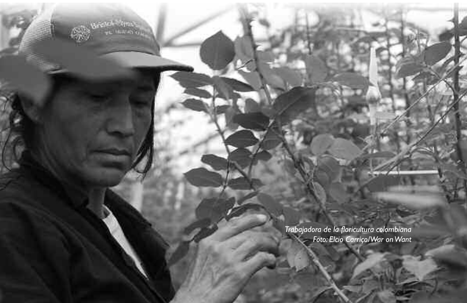
Trabajadora de la floricultura colombiana

El acoso sexual en las fincas es muy común, en parte debido a las condiciones de trabajo que tienden a poner en peligro la seguridad de las mujeres. Los trabajadores normalmente trabajan en zonas muy solas, en invernaderos inmensos, y se encuentran tan lejos uno del otro que nadie puede ver ni escuchar si pasa algo. Un estudio realizado en Ecuador ha encontrado que 55% de las trabajadoras entrevistadas han experimentado algún episodio de acoso sexual en el trabajo. 20 Desdichadamente, las mujeres son renuentes a denunciar dichos incidentes o a hablar de ello, en gran medida debido a la falta de seguridad laboral.