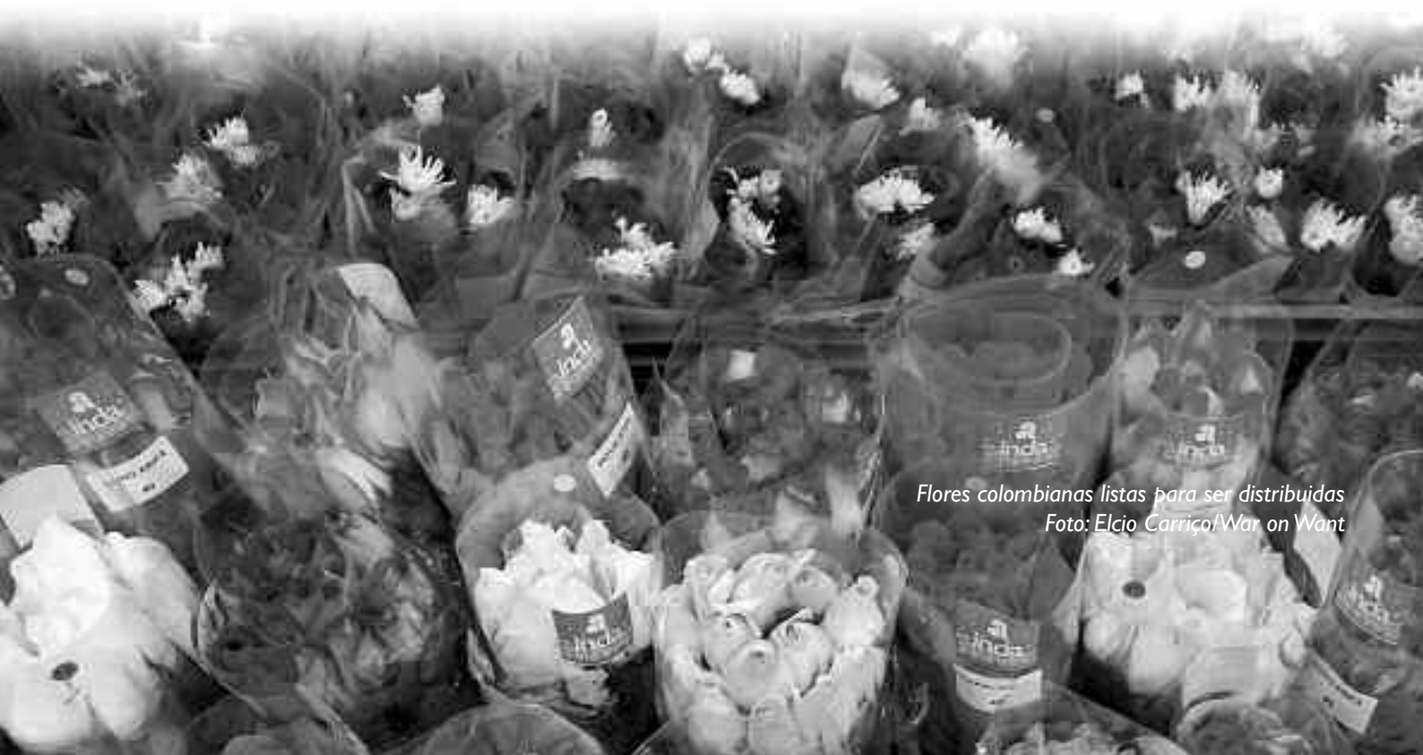
Flores colombianas listas para ser distribuidas

Desde que los problemas en la industria empezaron a salir a la luz hace 10 años, se han establecido varios códigos y criterios de calidad con el fin de tratar las deplorables condiciones laborales y los efectos negativos medioambientales que tienen las prácticas que se realizan en las fincas. Sin embargo, estos códigos de conducta son voluntarios y no consiguen proteger a los trabajadores de forma adecuada. Además, a esta situación se suma la carencia de sindicatos en el sector, la falta de instituciones reguladoras internas y la confusión generalizada sobre qué códigos hay que cumplir.